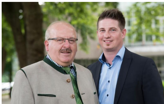
Bürgermeister: Franz Pühretmayr e.h.

Bitte nehmen Sie in dieser außergewöhnlichen Pandemie-Situation an dieser Online-Bürgerbeteiligungsaktion teil und besuchen sie ab 25. März 2020 unsere Homepage www.gemeindeneukirchen.at .